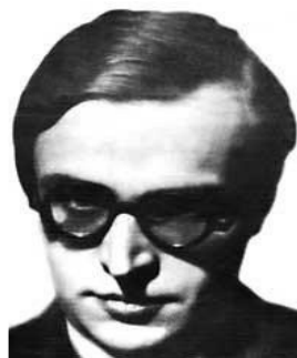
Alexandre Kojève, padre dell'idea tecnocratica dell'Europa.

La reflazione fiscale in deficit è il male assoluto per l'ideologia europea. L'elettore italiano lo sa bene, ma civetta con l'eresia in gran parte guidato dalla pancia, ma anche perché l'ortodossia gli appare sempre meno coerente con se stessa.