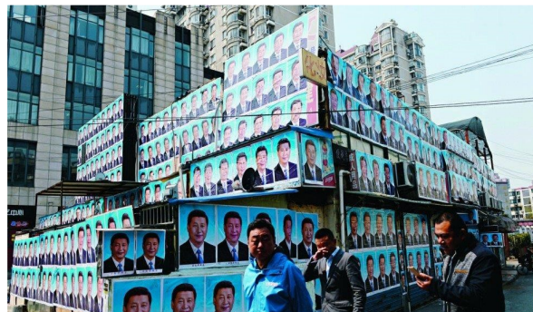
Manifesti di Xi Jinping a Shanghai.

Nella seconda metà del 2020 e per tutto il 2021 il mondo non sarà in recessione. Quanto meno, non lo saranno la Cina e tutte le economie che le ruotano intorno. Il primo luglio 2021 cadrà infatti il centesimo anniversario del Partito Comunista Cinese e la sua leadership farà il possibile e anche l'impossibile per presentare ai cinesi e al mondo un paese stabile e fortemente orientato alla crescita. Anche se negli ultimi tempi Xi Jinping ha messo l'accento più sulla qualità che sulla quantità della crescita, possiamo stare certi che, quale che sia l'obiettivo per il Pil del 2021, questo verrà non solo raggiunto ma anche superato.