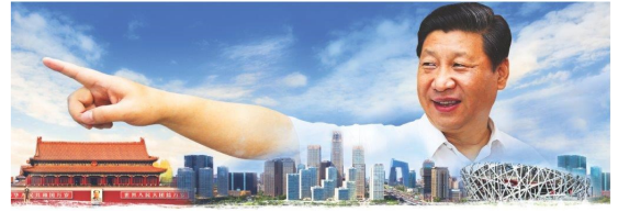
Xi, il nuovo Grande Timoniere.

Ecco allora che l'Europa, alla fine degli anni Ottanta, si inventa una sua ideologia (i diritti umani e il patriottismo della costituzione). Il filosofo ufficiale dell'Unione, Jürgen Habermas, parte dal kantismo di Kelsen e dal modernismo di Max Weber e confeziona un sistema che, ancora una volta, è più liberale che democratico. È un sistema che da una parte non sempre dà gran prova di sé una volta declinato nella pratica (la tragedia dei Balcani, la guerra civile ucraina, la Libia, la Siria, la gestione dell'immigrazione) e che soprattutto, nel suo algido formalismo, non scalda i cuori.