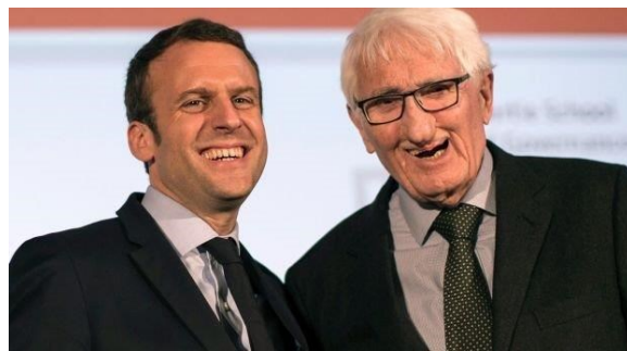
Habermas e Macron.

Un americano direbbe invece che a casa sua il Patto di Stabilità e Crescita (dove la crescita venne aggiunta solo per bellezza) sarebbe semmai un Patto di Crescita e basta. Nel suo universo parallelo ci sarebbe un vincolo di