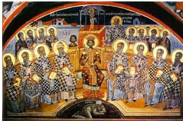
Il dibattito tra Chiesa d'oriente e d'occidente prima dello scisma. 1054.

E accanto ai Mondonuovisti Radicali, che si muovono sui tempi lunghi della storia, abbiamo anche i Pessimisti Tattici, che si confinano nei tempi ravvicinati del trading. Per Andrew Sheets di Morgan Stanley il 10 per cento di ribasso d'inizio febbraio è solo un aperitivo. Il pasto completo verrà servito nel corso del secondo trimestre, quando ci accorgeremo che l'economia americana, lungi dall'accelerare, darà in realtà segni di rallentamento. E qui, aggiungiamo noi, si va a toccare un nervo esposto anche in Europa. Quando