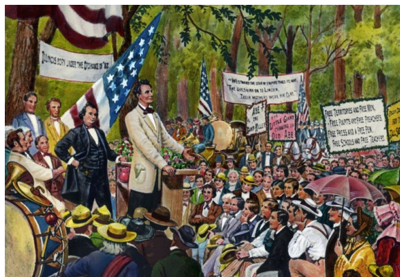
Uno dei celebri dibattiti tra Lincoln e Douglas. 1858.

In altre parole navighiamo a vista in un anno, il 2018, che è più appropriato definire di transizione che di cambiamento radicale. Stiamo passando dal mondo iperprotetto del Qe al mondo duro che si profila dal 2019 in avanti, ma né l'inflazione né le curve dei tassi cambieranno quest'anno così tanto da mettere seriamente a rischio i nostri portafogli. Dopotutto c'è sempre un cuscino costituito dall'incremento degli utili del 20 per cento in America e tra il 10 e il 15 nel resto del mondo, un cuscino che dovrebbe attenuare eventuali cadute e l'inevitabile compressione dei multipli.