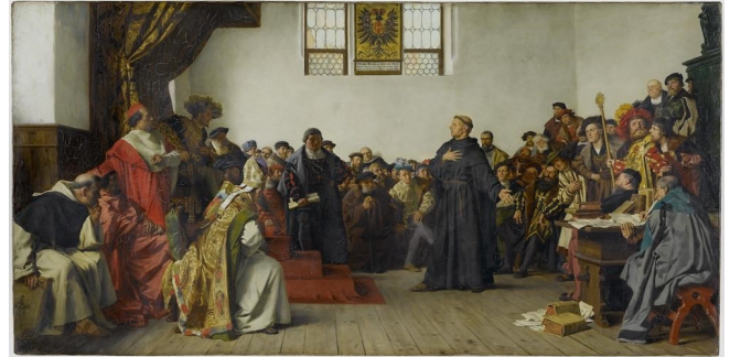
Il dibattito tra Lutero e i principi alla Dieta di Worms.

Da qui traiamo alcune indicazioni. Il dibattito intellettuale e le ardite speculazioni che stanno riprendendo a circolare sono infinitamente più stimolanti e affascinanti delle discussioni ossessive sul tapering della Bce cui ci eravamo ridotti, ma se vogliamo rimanere con i