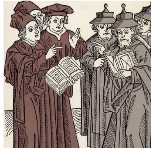
Disputatio tra studiosi cristiani ed ebrei. 1483.

La prima ricorda quello che avviene nello spazio. Per mezzo secolo, dallo Sputnik in avanti, abbiamo mandato di tutto lassù e tutto è stato affascinante ed eccitante. Ora, per molti anni, dovremo ripulire il cielo dai satelliti morti e dai detriti di quelli esplosi, un lavoro costoso e per nulla emozionante. Del Qe abbiamo vissuto finora la parte divertente, ora ci tocca il suo smantellamento, qualcosa di cui oltretutto non abbiamo esperienza nella storia.